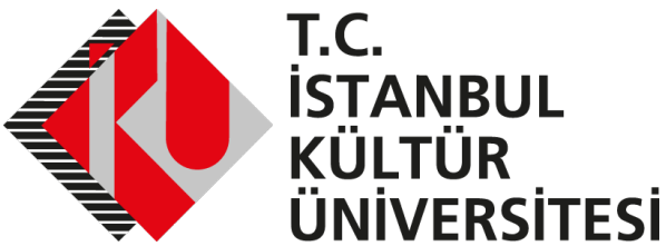
Şekil 1. İstanbul Kültür Üniversitesi logosu